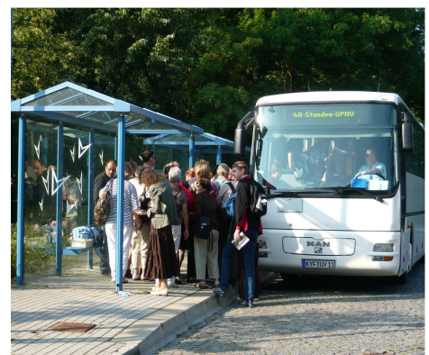
48 Stunden zwischen Südharz und Kyffhäuser