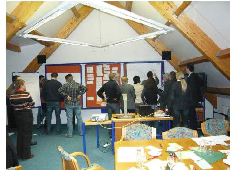
Arbeit des Stammtisch Nahverkehr

Die Bearbeitung des Projektes erfolgte in Kooperation mit dem Verkehrsverbund Berlin Brandenburg.