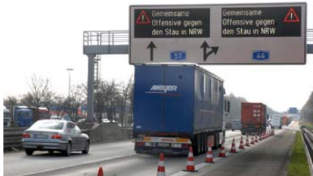
Bildunterschrift: Bild1_Verkehrsmanagement Integriertes Strategiemangement für fließenden Verkehr

Download unter: www.ptv.de/news/presse/bilder